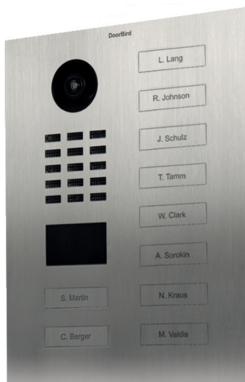
D2110V kymmenellä painonapilla