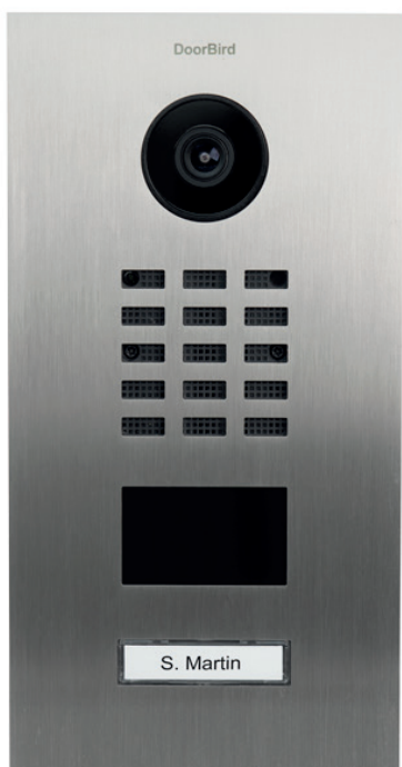
D2101V yhdellä painonapilla