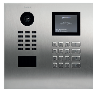
D21DKV ja D21DKH